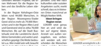
LEADER ermöglicht es, lokale Akteure, bestehend aus Vereinen, Wirtschaft und Kommunen, die besten Ideen aus der Region zu entwickeln.