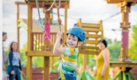
LEADER-geförderte Begegnungs- und Freizeitsplätze stärken den ländlichen Raum.