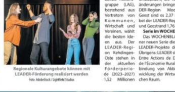
Regionale Kulturangebote können mit LEADER-Förderung realisiert werden.